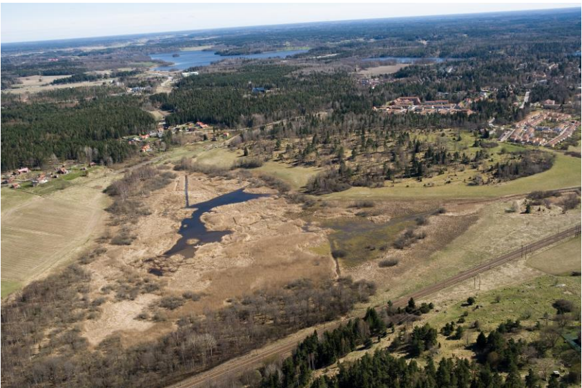
Det gröna och blå Knivsta.

En blommande hagmark eller en mogen skog är resultatet av många års kontinuerlig vård och skötsel. Det kan röra sig om omloppstider på allt från 80 till hundratals år för skog att växa upp till mogen ålder. Därför behövs en god strategi för hur man ska vårda och förädla våra naturområden för framtiden. Den här strategin skall styra skötselarbetet i skog och natur. Till strategin finns en skötselplan som i detalj styr skötseln av skog och natur i den riktning som strategin pekar ut.