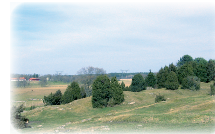
Hönsgårde Gravfält från järnåldern.