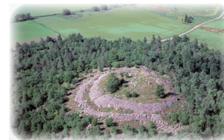
Broborg Fornborg från järnåldern.