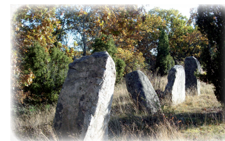
Vallbyåsen Gravfält och resta stenar.