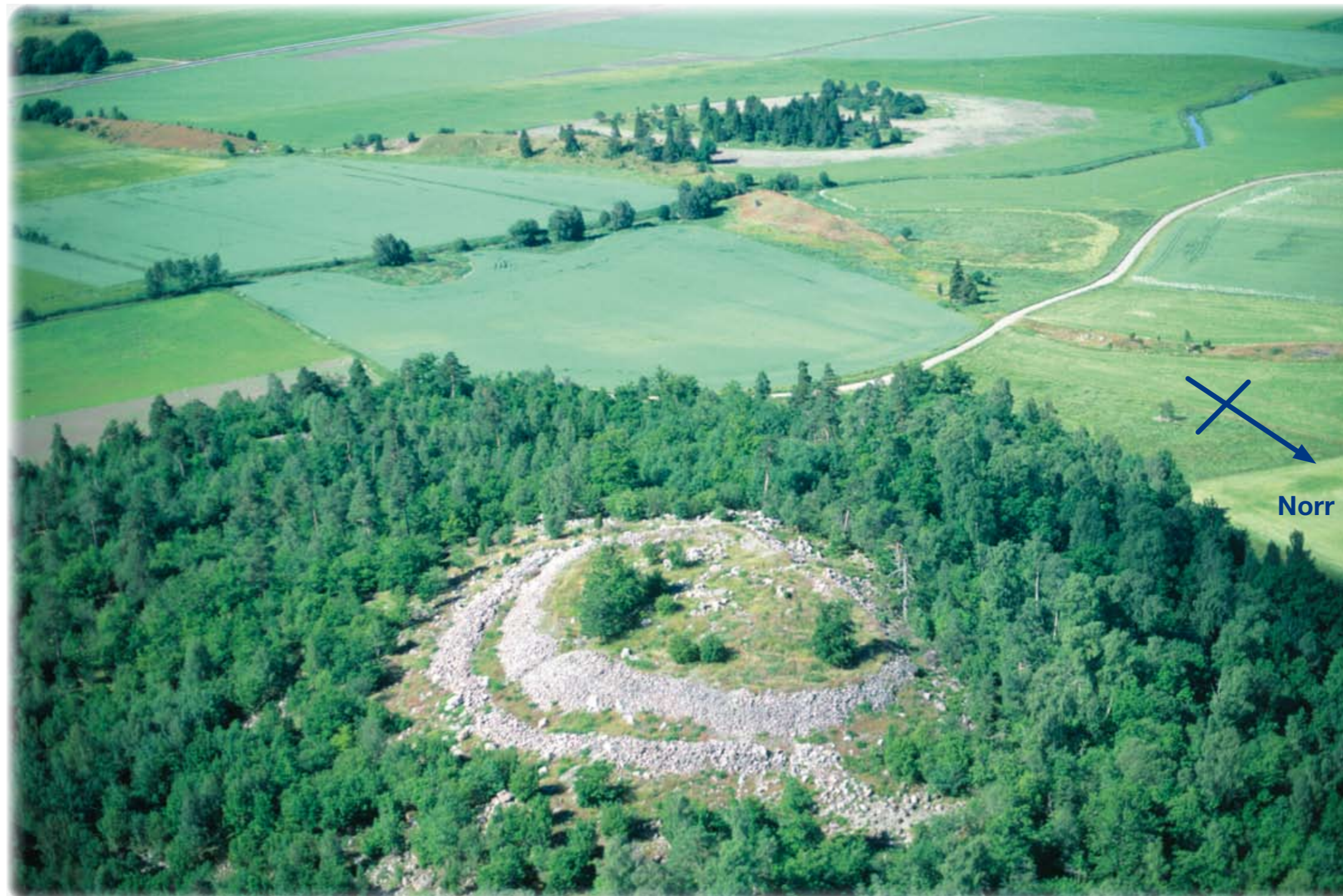
Borgen sedd från nordost - flygbild från 1990-talet

Du befinner dig nu vid foten av det berg där Broborg ligger. Framför dig öppnar sig den dalgång som vi idag kallar "Långhundraleden". Under bronsåldern gick vattnet upp till foten av berget. Man kan också se rester av Vallbyåsen som bildades av inlandsisen. Åsen som går tvärs över dalen dämde upp vattnet och det bildades en stor sjö som ingick i ett system av sjöar och åar som förband Östersjön med det inre av Uppland. Just här blev farleden trång och besvärlig och uppe från höjden där borgen ligger var leden lätt att övervaka. Utmed åsen gick landvägen och vid Broborg mötte den vattenleden.