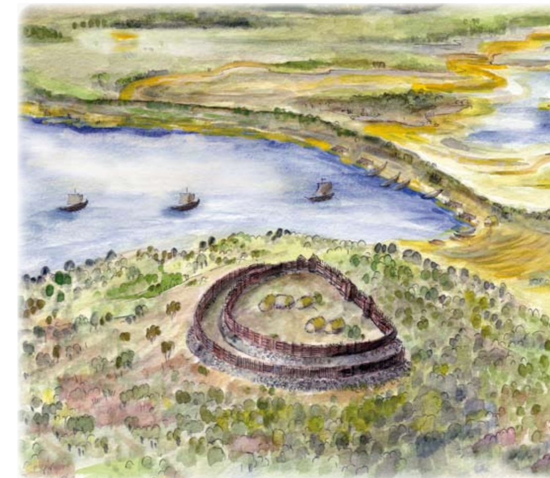
Samma vy som fotot till vänster - så här kan det ha sett ut på 400-500 talet e. Kr.