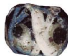
Pärla, original ca 1,5 cm

Vid undersökningar i borgen har arkeologer funnit kulturlager och fynd som visar att människor periodvis vistats innanför murarna. Man har funnit djurben, bränd lera, kol, krukskärvar och en pärla. Vattenförsörjningen var viktig under de tider då man använde borgen. Broborg har ännu två källor intill berget.